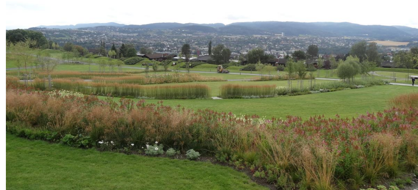
Havstein i Trøndelag (fra 2014).

- med noen særlige problemstillinger som også går utenfor gravplassen