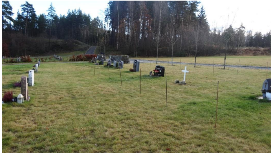
Fra Eidanger i Vestfold og Telemark.