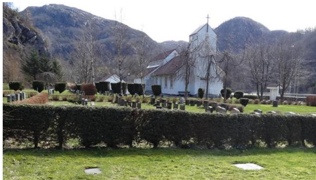
Trossamfunnsgravplass i Eigersund kommune.