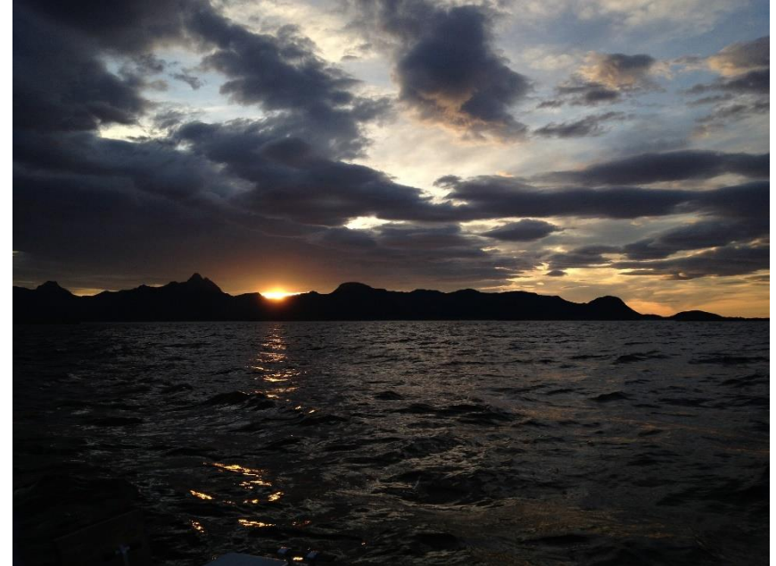
Illustrasjonsfoto fra Pixabay