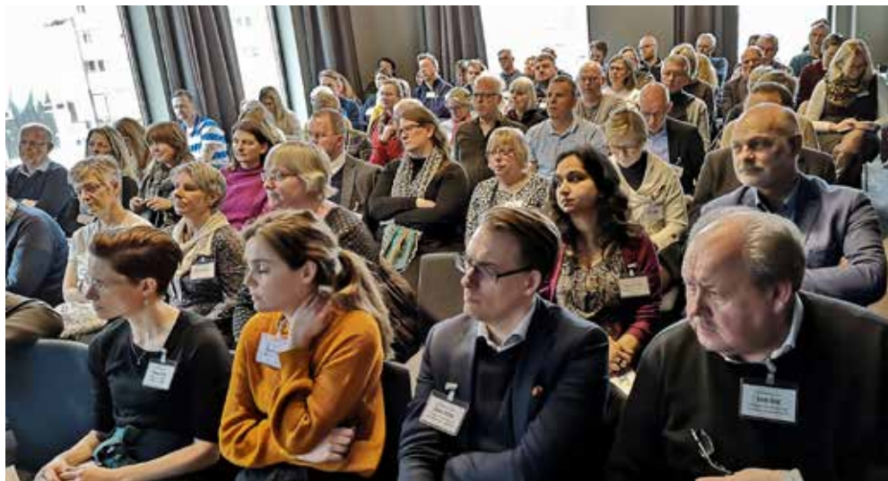
Nordisk seminar i Drammen i mars 2020