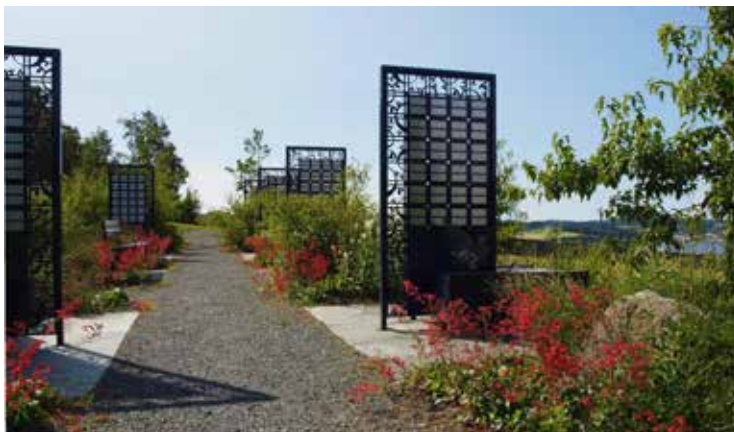
Alstadhaug kirkegård i Levanger vant prisen "Årets beste navna minnelund"

Foreningen har opprettet en pris for "Årets beste". For 2019 var temaet "Årets beste navna minnelund", og Alstadhaug kirkegård i Levanger gikk av med seieren. Prisen er kr 10 000 og et diplom.