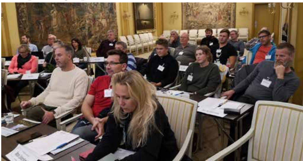
Fra kurset i Sandefjord i oktober 2019, i staselige omgivelser på Park Hotel

7. - 10. oktober 2019 i Sandefjord. 30 kursdeltakere.