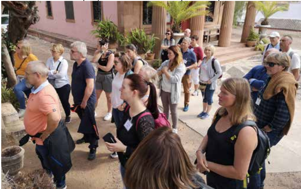
Fra kurset i administrasjon av gravplasser i oktober 2019: Befaring til Den engelske kirkegården i Malaga.

21. - 26. oktober 2019 på Sjømannskirkens El Campanario i Spania. 27 kursdeltakere.