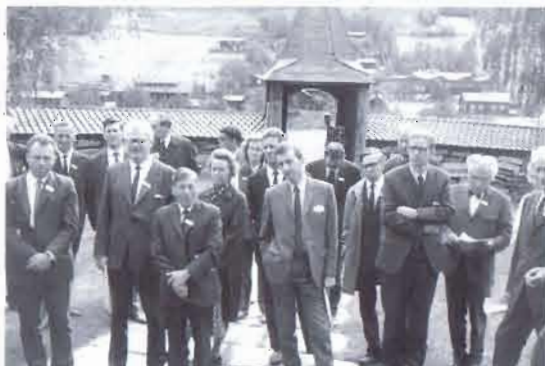
Landsmøte i Lom 1971. Deltakerene lytter til orientering utenfor Lom kirke.