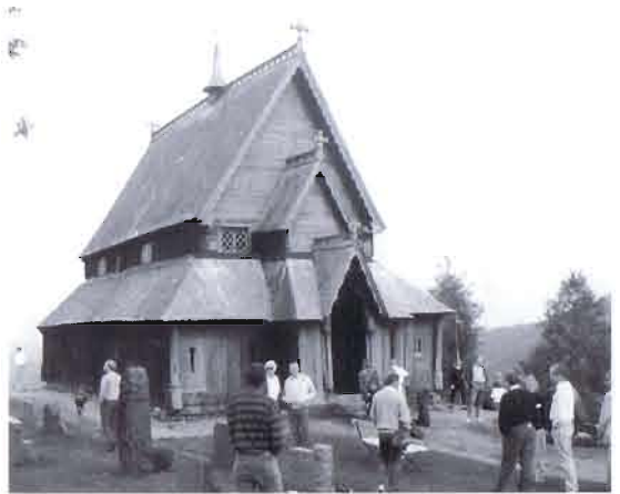
Tema for fagdage i 1990 var “Bevaringsverdige anlegg og bygninger” og flere stavkirker i Valdres ble besøkt under befaringen. her er det gjort stopp ved Reinli kirke.