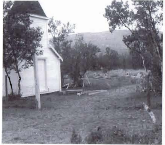
Mange kirkegårder var i 50- og 60-årene preget av forfall og manglende vedlikehold

På interimsstyrets møte 20.4.1964 ble man enige om at man som et "arbeidsnavn" skulle kalle foreningen "Landslaget for kirkegårdskultur."