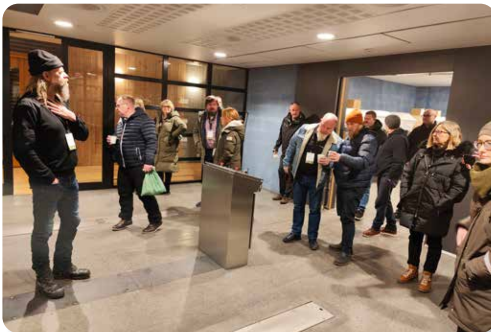
Fagdager for krematorier i 2023 var i Trondheim. Her på befaring til Mohold krematorium